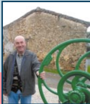
Le patrimoine du village, comme cette pompe, est mis en valeur.