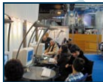
Un équipement de pointe pour permettre à tous d'accéder aux nouvelles technologies

Ouverte à tous, la cyberbase tournera avec trois animateurs et proposera des formations, de la consultation en libre service et des animations, avec une vingtaine de postes informatiques. Ce pôle de ressources et d'information très branché accueillera dans ses murs le PIJ (Point Information Jeunesse). Il sera ouvert certains soirs et le samedi. ●