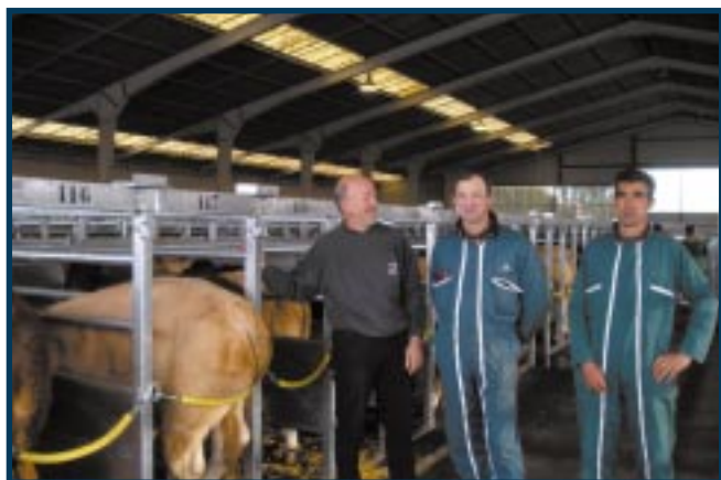
Tous les 2 èmes lundis et 4 èmes mardis du mois, le marché aux veaux mobilise le maire (à gauche) et 20 employés et bénévoles