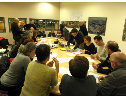
Atelier de définition des enjeux 2015

Consultation des personnes publiques et Enquête publique