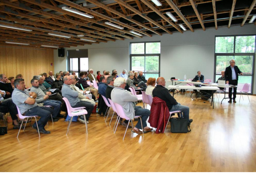
Débat PADD à la salle des Pilotis à Blaye-les-Mines en avril 2017